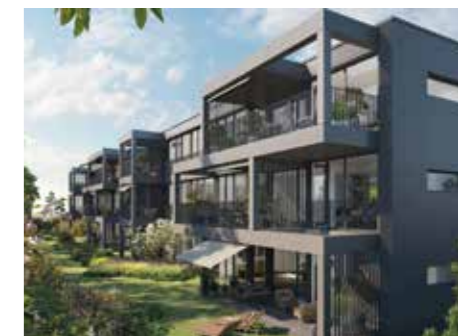
... und nachher.