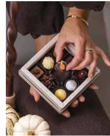
Schokolade, die glücklich macht.

Selbstverständlich sind die Verwendung regionaler Produkte, ein fairer Vertrieb der Schokolade. Die Grundcouverturen sollen nicht süss sein, anstatt mit Zucker