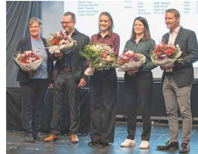
Der neu gewählte Gemeinderat von Köniz.