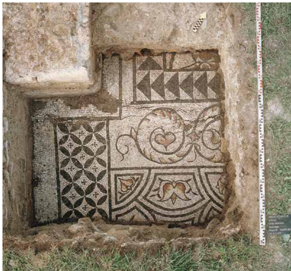
Dieses Mosaik schmückte vermutlich den Boden der Bibliothek eines römischen Gutshofes im Breitenacher.

Im Rahmen einer Rettungsgrabung suchte 2015 der Archäologische Dienst im oberen Breitenacher auf einer Fläche von insgesamt 15 000 m 2 nach Spuren der vermuteten bronzezeitlichen Siedlung. Dabei wurden neben Feuerstellen und Keramikscherben zahlreiche Pfostengruben entdeckt, die über die Existenz einer prähistorischen Landsiedlung mutmassen liessen. Pfostengruben im Verbund mit verschiedenen grossen Steinen sind ein deutlicher Hinweis auf Gebäude aus Holz und Lehm, die auf Holzpfosten gebaut worden sind. Diese Pfosten verfaulen im Laufe der Zeit vollständig, sodass nur die unterschiedlich grossen Keilsteine erhalten bleiben, die die Pfosten in der Boden-grube fixiert hatten. Die grosse Anzahl