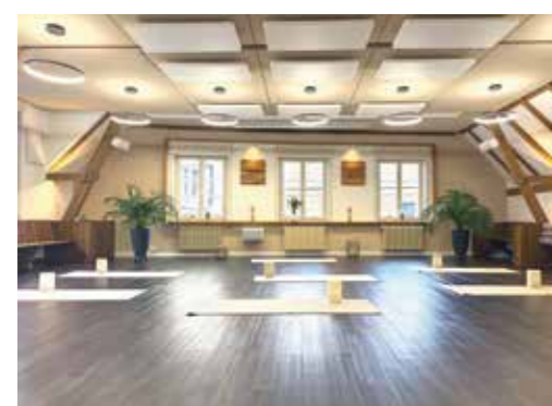
MK Fitness Gruppentraining