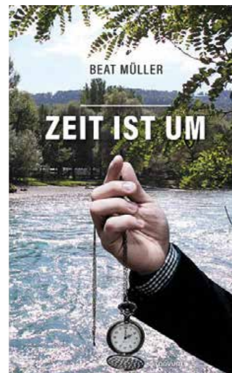
Der Buchumschlag von «Zeit ist um». Bezugsquellen: Matte-Buchladen «einfach lesen»; Rezeption Campingplatz Eichholz; Orell-Füssli; Amazon als E-Book.

Der Titel selbst entspringt einem Spruch eines bei uns im Eichholz eingesetzten Asylbewerbers, der im Rahmen des Beschäftigungsprogramms einen bemerkenswerten Fleiss gezeigt hat. Unvergesslich für uns war auch sein konsequenter Arbeitsabbruch bei Ablauf der Arbeitszeit. Das damit verknüpfte Bild gefällt mir gut. Zwar schaffe ich gern. Aber der gewählte Zeitpunkt für das Ende der Berufszeit war richtig. Das gilt auch für die jetzige Situation. Mein Rentnerdasein würde ich sogar als eigentlichen Traumberuf be-