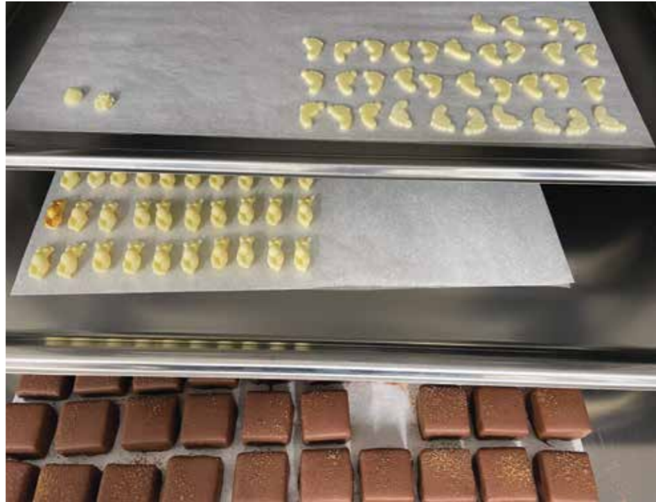
Vorlagen aus dem 3-D-Drucker ermöglichen die Herstellung von mit Schokolade ausgegossenen Formen. Vergoldet verziern sie die Pralinen.